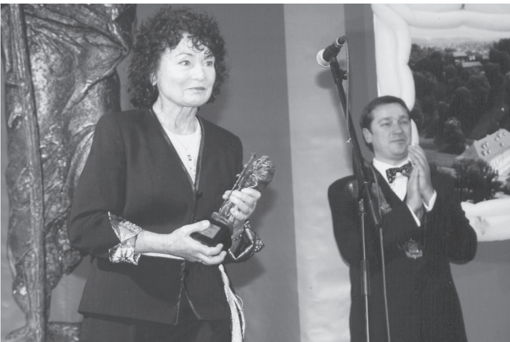
Šv. Kristoforo statulėlės įteikimo iškilmė

pradžios, nuo 1939 m. vos pradėjusių kvėpuoti Vilniaus universiteto klinikų iki dabar. Ji dėkojo kolegoms, išvardydamą daug nuo pirmininkavimo draugijai pradžios su ja kartu dirbusių žmonių – ir iš Vilniaus medicinos draugijos, ir universiteto, ir studentų mokslinės draugijos.