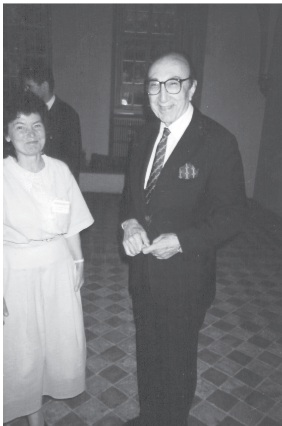
Su profesoriumi Michaeliu De Bakey

duotuvėje norėjęs nusipirkti nailono, bet šis jau buvęs išpirktas. Pardavėja pasiūlė pirkti naują audinį – dakroną. Parėjęs namo su žmonos siuвамąja mašina pasiuvo pirmąją dirbtinę kraujagyslę ir ją išbandė eksperimento metu. Tais pačiais metais panaudojo ją klinikoje arterijos šuntavimo operacijai. M. De Bakey (su bendraautoriais D. A. Cooley, E. S. Crawford, D. S. Morris) knyga Tarybų Sąjungoje pasirodė 1960 m. Ją nusipirkau 1961 m. lapkričio 26 d.