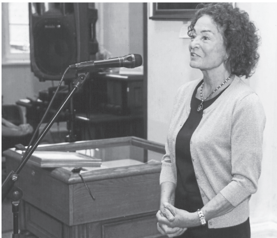
Knygos „Prie Vilniaus medicinos draugijos versmės“ pristatymo metu