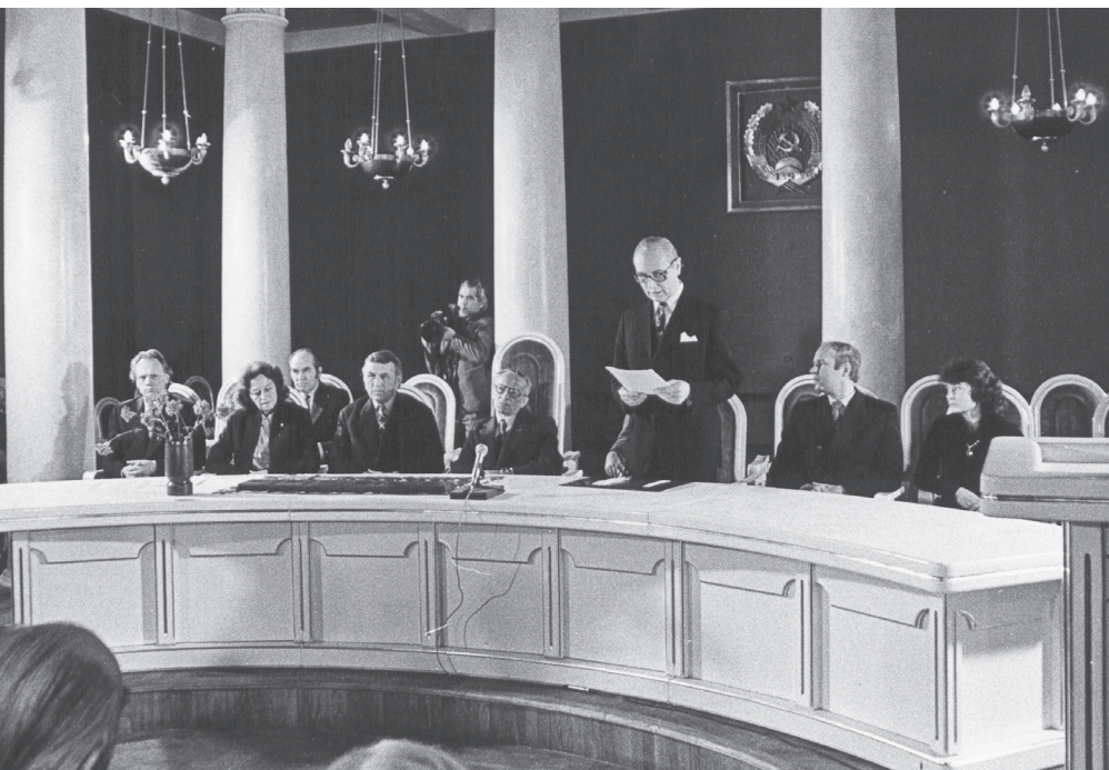
Vilniaus medicinos draugijos 175-ųjų metinių minėjimas Vilniaus universitete