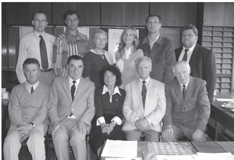
Vilniaus medicinos draugijos valdyba. 2005 m.