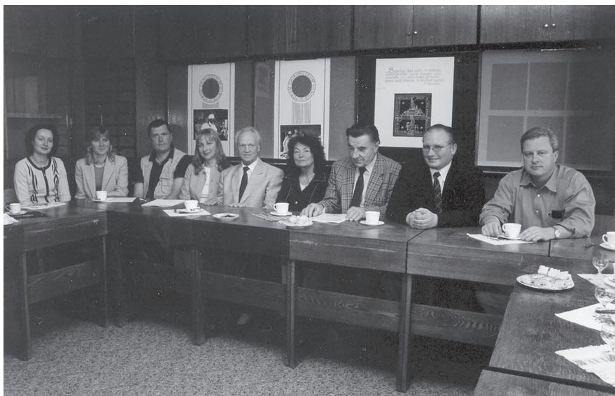
Vilniaus medicinos draugijos valdybos prezidiumas. 2008 m.

geriausią 2008 metų mokslo darbą. Lietuvos medicinos bibliotekoje ir Vilniaus miesto klinikinėje ligoninėje 2008 m. eksponuota paroda „Moderni kraujagyslių chirurgija Lietuvoje“.