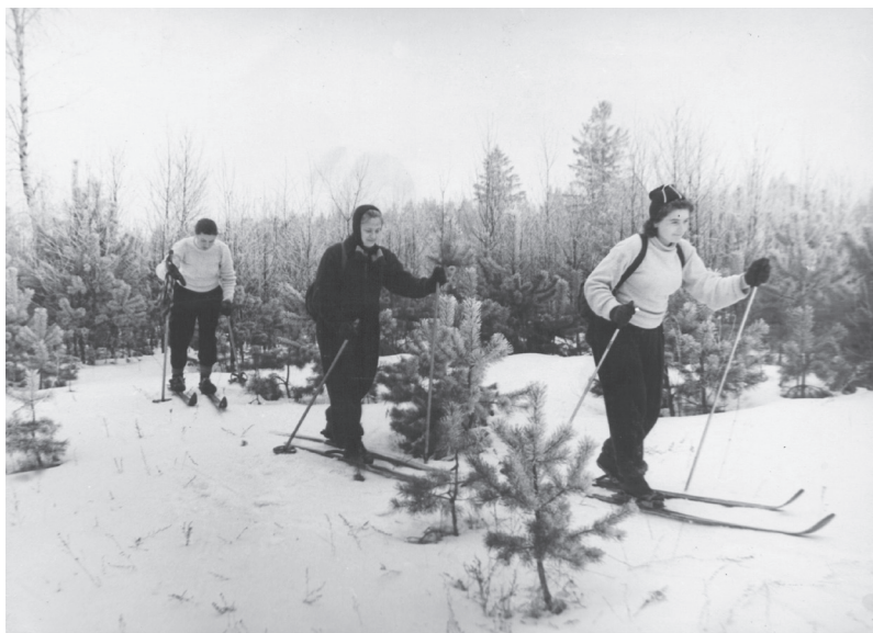
Slidžių žygis. 1960 m.