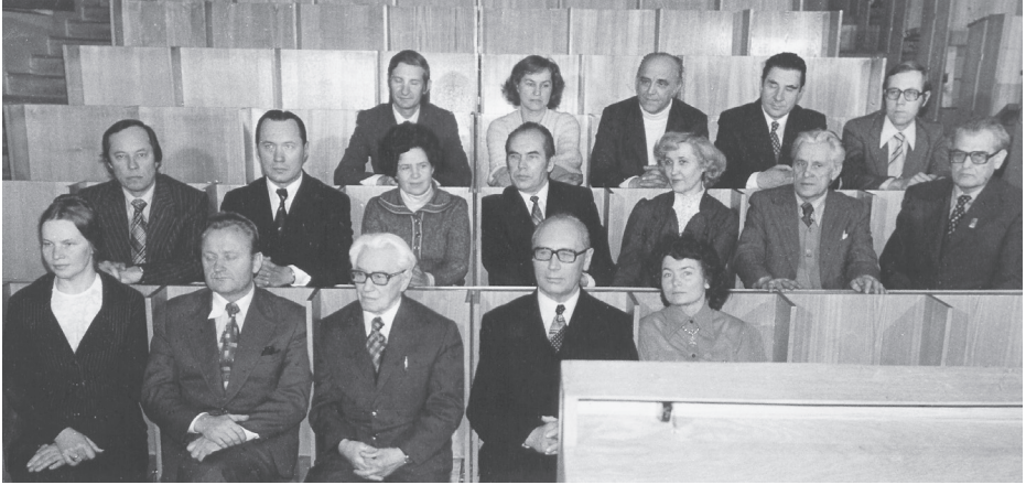
Vilniaus medicinos draugijos valdyba. 1977 m. kovo 11 d.

tinusi įvairių specialybių gydytojus ir medicinos mokslo atstovus. Jų dalyvavimas buvo labai svarbus svarstant visiems aktualias posėdžių temas.