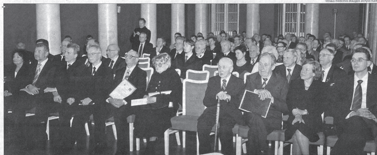
► SUKAKTIS. Vilniaus medicinos ir Vilniaus chirurgų draugijų iškilmingas posėdis 2009 m., minint Chirurgų brolijos 500 m. jubiliejų Vilniaus universiteto Mąžoje auloje